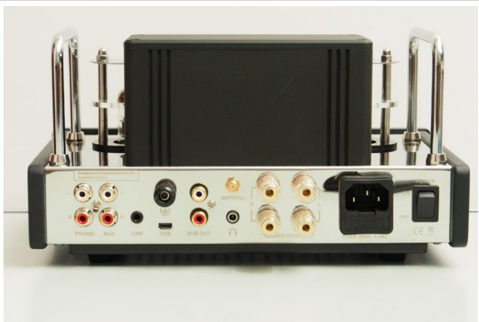
每聲道具備 20W 功率輸出。