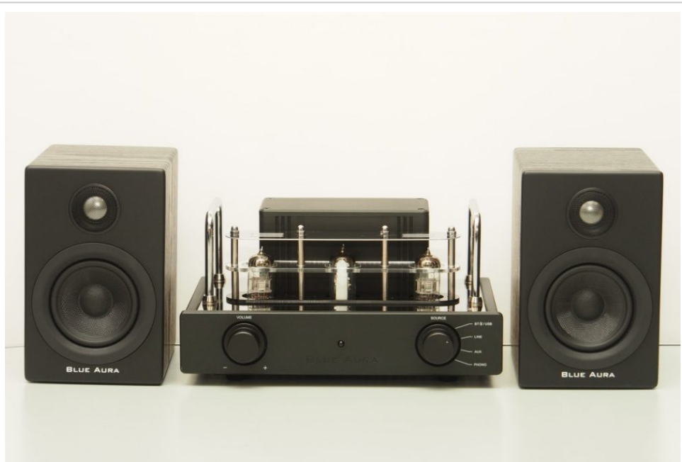
今次配合同廠 ps30 一起測試。

至於新款 v32 如何，當然要試過至知，今次就連接同為 Blue Aura ps30 書架喇叭一起測試，ps30 採用 3/4 吋軟球頂高音與 3.5 吋紙盤中低音單，可承受最高 30W 輸入功率。